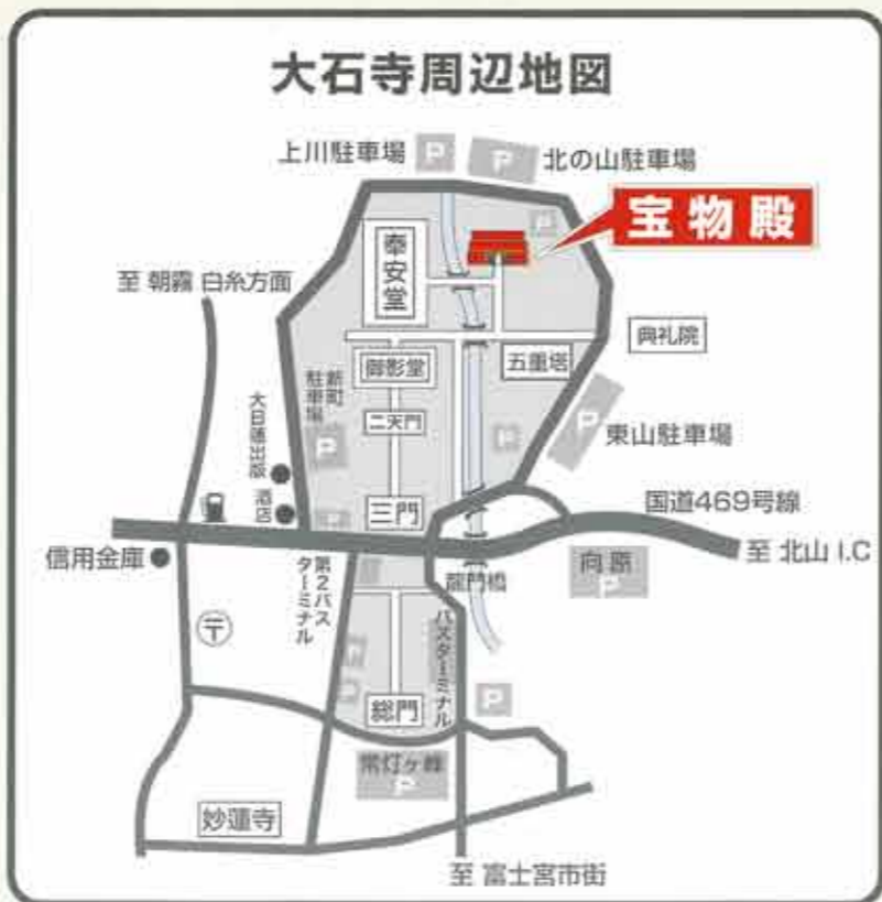
日蓮正宗総本山 大石寺