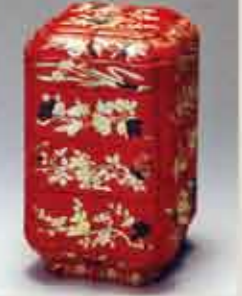
朱漆草花螺鈿重箱